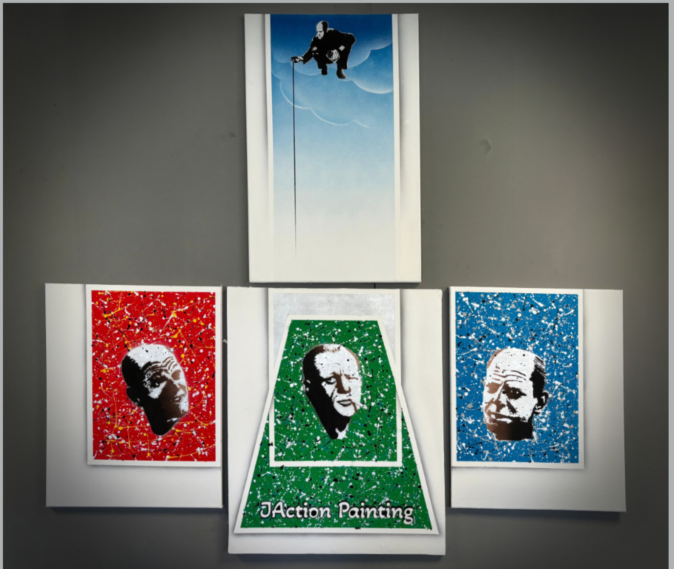
JAction Painting, 2025 Sprühfarbe auf Leinwand

Dieses Werk portraitiert Jackson Pollock im Spiegel seiner inneren Zustände: Rechts der depressive Rückzug in Blau und Grau, links die manische Ekstase in Rot und Gelb, in der Mitte der Moment innerer Balance in Grün und Türkis - ein Lichtspalt zwischen den Extremen. Silber und Schwarz ziehen sich durch alle drei Portraits – als Grundrauschen, als Licht und Schatten, die in jedem Zustand mitschwingen.